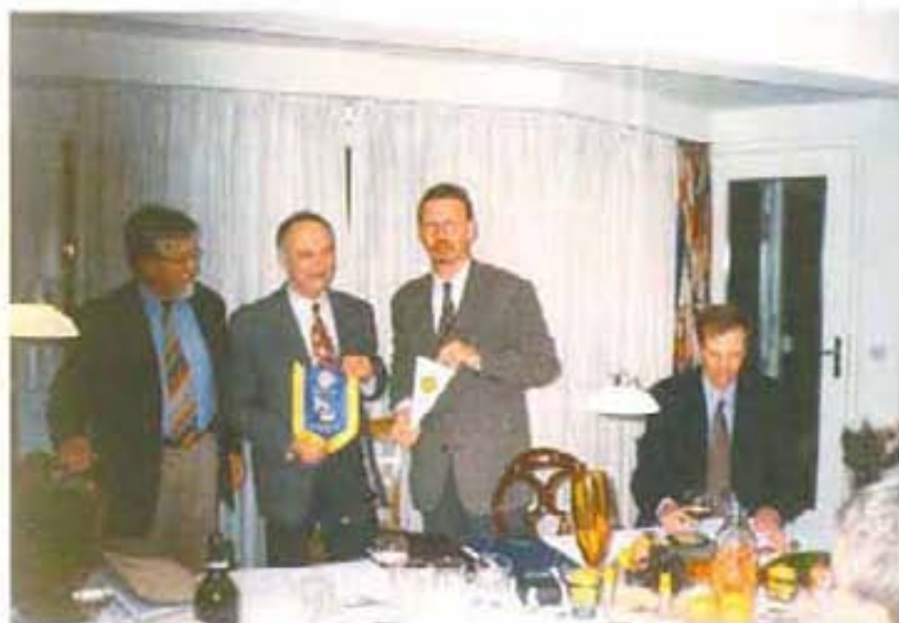
Среща на президента на РК - Бургас, Стефан Вълчев с РК - Щаде, Германия - Щаде, ноември 2000 г.