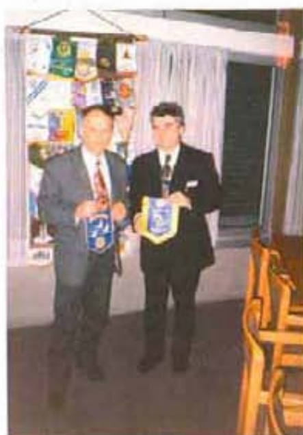
Президентите на РК - Бургас, и РК - Еквернфорде

РК - Бургас, бе избран от РК - Бад Кисинген, Германия, а след това и утвърден писмено от Фондация Ротари като участник в реализиране на Мечинг Грантс проект - закупуване на микробус за сиропиталище Дом „Ронкали“ към фондация КАРИТАС на стойност 13 000 USD.