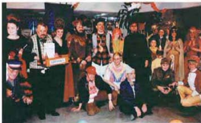
На маскения бал