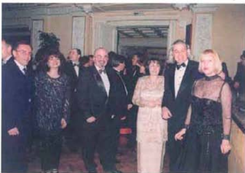
На бала на софийските Ротари клубове