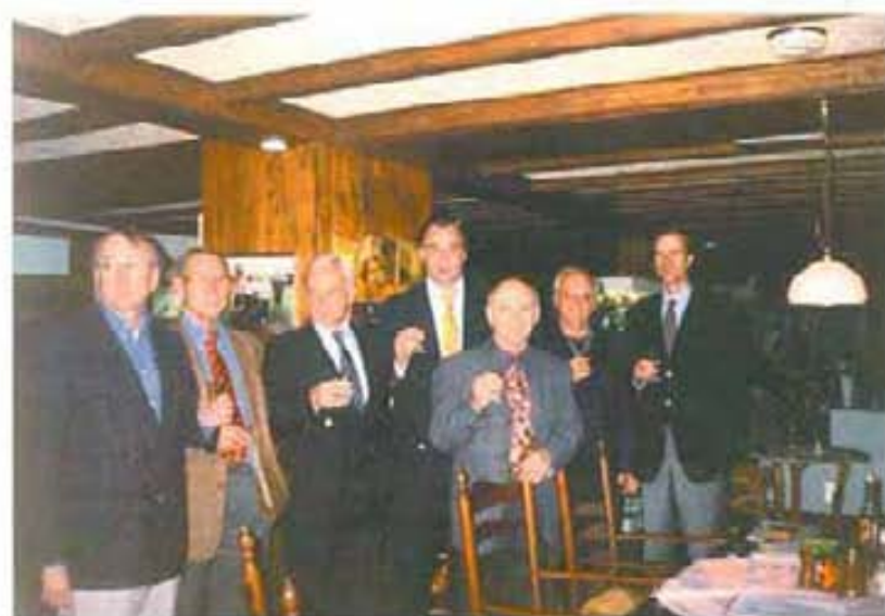
Представители на клубовете от Бургас, Щаде (Германия) и Леккеркерк (Холандия) по време на срещата за обсъждане кандидатурата за Мечини грантс, ноември 2000 г.